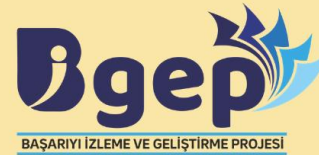
BAŞARIYI İZLEME VE GELİŞTİRME PROJESİ